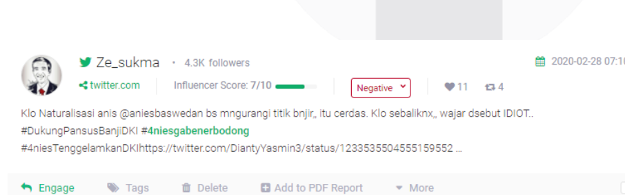
GAMBAR 1.6 CONTOH MERUNDUNG SIBER 1