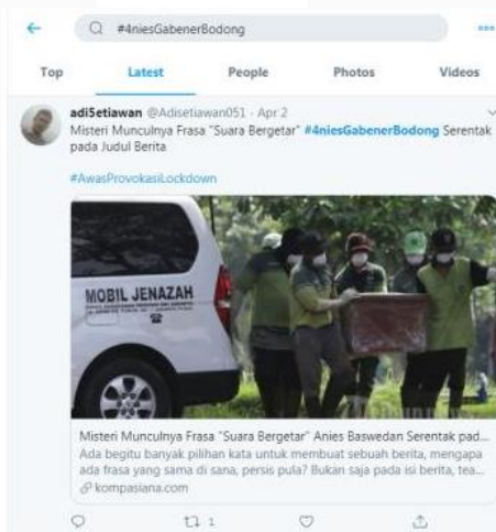
GAMBAR 1.4 PERIODE HASTAG 1

Tagar #4niesGabenerBodong ramai dibahas oleh warganet dan mulai diperbincangkan dari tanggal 26 Februari hingga 2 April 2020.