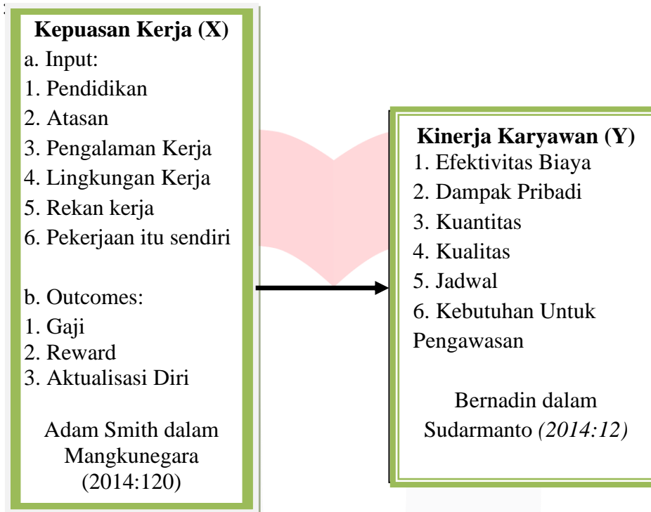
Gambar 1: Kerangka Pemikiran

Berdasarkan penjelasan dari uraian teoritis di atas, kerangka konseptual dari penelitian yang dilakukan dijabarkan dibawah ini: