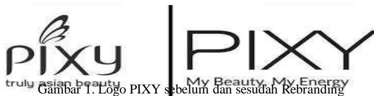
Gambar 1. Logo PIXY sebelum dan sesudah Rebranding

Pada Tahun 2018 PIXY melakukan proses rebranding, dengan melakukan melakukan strategi repositioning melalui perubahan logo, tagline, serta tone & manner yang baru dengan tujuan untuk memperkuat image modern & high quality. Berikut perbandingan tampilan tagline PIXY sebelum dan sesudah rebranding .