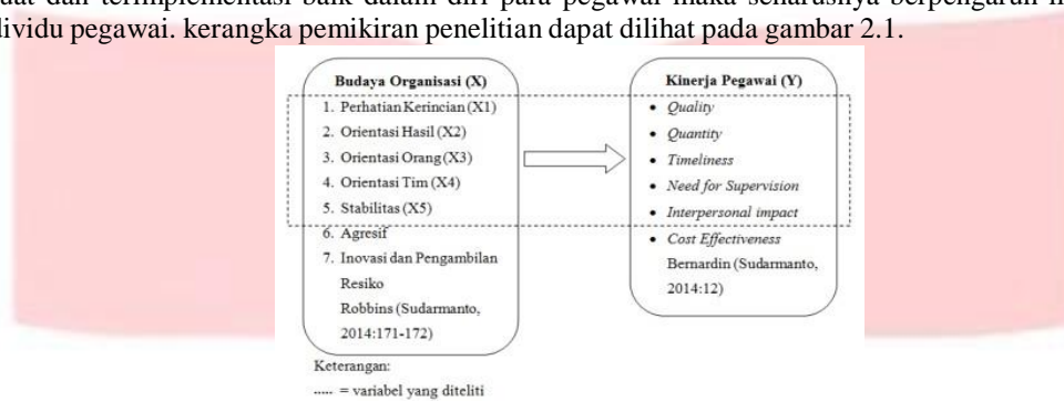
Gambar 2.1 Kerangka Pemikiran

Ditinjau dari teori-teori atau pun hasil dari penelitian terdahulu yang telah dikemukakan di atas, maka dapat diartikan bahwa peranan budaya organisasi/ perusahaan sangat berpengaruh terhadap peningkatan maupun penurunan kinerja individu maupun organisasi. Jika budaya organisasi dalam suatu perusahaan terbukti dalam kategori kuat dan terimplementasi baik dalam diri para pegawai maka seharusnya berpengaruh linier terhadap kinerja individu pegawai. kerangka pemikiran penelitian dapat dilihat pada gambar 2.1.