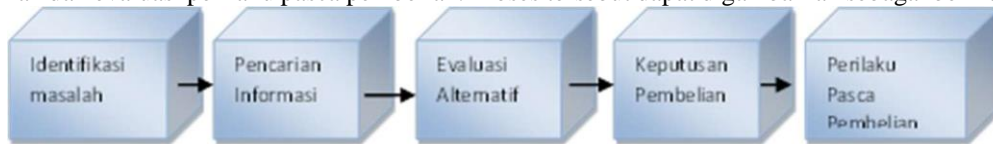
Gambar 1. Tahap Pengambilan Keputusan

Menurut Kotler dan Armstrong (2012:416) Proses pengambilan keputusan konsumen meliputi serangkaian kegiatan mulai dari identifikasi kebutuhan / masalah, pencarian informasi, evaluasi alternatif, keputusan pembelian dan evaluasi perilaku pasca pembelian. Proses tersebut dapat digambarkan sebagai berikut: