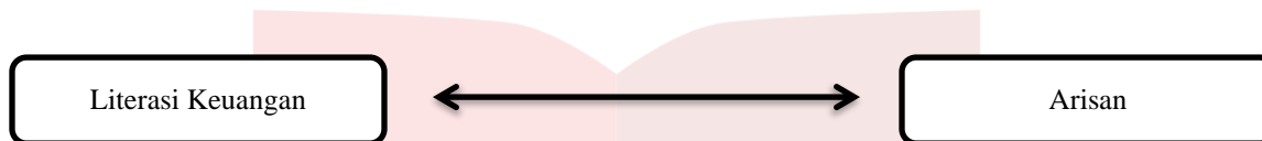
Gambar. 1 Kerangka Pemikiran

Berdasarkan kerangka teori diatas, dapat disusun kerangka konseptual penelitian sebagai berikut: