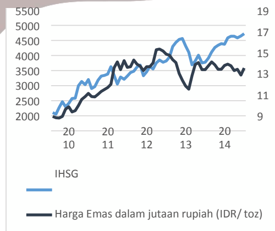
Gambar 2. Grafik Pergerakan IHSG dan Harga Emas Dunia (IDR/ toz) Periode 2010-2014 Sumber: SEKI dan www.kitco.com , data diolah

Pergerakan harga emas dunia dilihat pada grafik tersebut terjadi penurunan terbesar sejak Juni 2013. Harga emas anjlok disebabkan spekulasi meningkat akan naiknya suku bunga AS sehingga mengurangi daya tarik emas karena tidak memberi bunga seperti aset lain. Pada saat sama, pembelian emas oleh China kurang dari yang diharapkan para analis. Hal itu membuat dolar Amerika Serikat terus semakin kuat [14] .