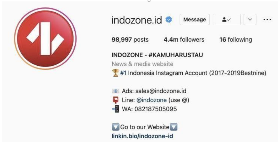
Gambar 3 Akun Instagram @indozone.id