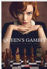
GAMBAR 1.1 POSTER THE QUEEN'S GAMBIT

Serial ini pun memberikan sudut pandang seorang Beth Harmon seorang anak perempuan yang mengalami kejadian tragis bersama ibunya dan berakhir di panti asuhan. Ketika tinggal di panti asuhan ini Beth mulai tertarik dengan permainan catur yang dimainkan oleh Mr. Shaibel. Hingga akhirnya Beth menjadi perempuan termuda yang pandai dalam memainkan papan catur dan kerap kali mengikuti berbagai kompetisi catur di Amerika Serikat. Beth mulai dikenal oleh banyak orang hingga dia di juluki dengan the Queen's Gambit karena kepandaianya bermain catur. Walaupun begitu Beth selalu mendapatkan Tindakan diskriminasi oleh lawan bermain catur. Para peserta kompetisi catur ini di dominasi oleh laki-laki, sehingga para kaum laki-laki ini merasa lebih dominan dan berkuasa ketika dihadapkan dengan lawan main perempuan. Dalam setiap pertandingan catur Beth diremehkan dan mereka beranggapan bahwa Beth dapat dengan mudah dikalahkan karena Beth ini adalah seorang perempuan yang mana pandangan mereka terhadap perempuan itu adalah sosok manusia yang subordinat dan kurang beruntung.