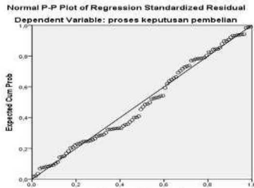
Gambar 3.1 Grafik Normal probability plot

Berdasarkan data yang diperoleh melalui kuesioner dapat dilakukan uji normalitas untuk mengetahui apakah data yang diperoleh berdistribusi normal atau tidak normal. Hasil pengolahan data melalui program SPSS 20 sebagai berikut: