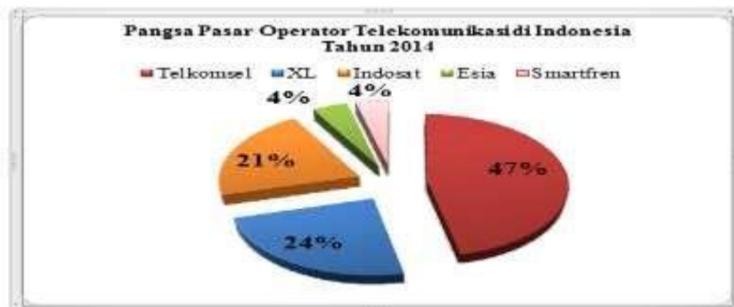
Gambar 1.1 Pangsa Pasar Operator Indonesia