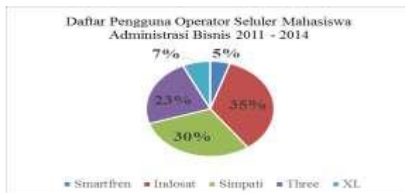
Gambar 1.2 Pengguna Operator Seluler Mahasiswa Administrasi 2011 - 2014

Penulis melakukan survey awal kepada 100 orang Mahasiswa Administrasi Bisnis Angkatan 2011 - 2014 dengan metode wawancara untuk mengetahui jumlah pengguna produk Indosat. Dari hasil survey tersebut dapat diketahui sebanyak 35 orang menggunakan Produk dari Indosat, 30 orang menggunakan Produk dari Telkomsel, 23 orang menggunakan Produk Three, 7 orang menggunakan Produk XL dan 5 orang menggunakan Produk dari Smartfren. Berikut adalah presentase pengguna operator seluler mahasiswa administrasi bisnis 2011 - 2014.