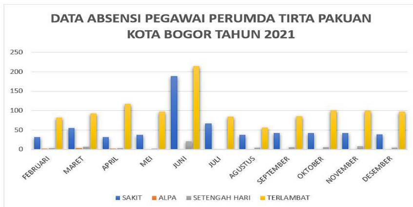
Gambar 2 data absensi pegawai

Berdasarkan gambar 1.4 data absensi yang dihimpun oleh peneliti menunjukkan masih naiknya tingkat konsistensi pada disiplin karyawan Perumda tirta pakuan kota bogor. pegawai perusahaan masih ada yang belum memaksimalkan kinerja kedisiplinannya terhadap kebijakan perusahaan yang telah ditetapkan sebelumnya, bawasannya ketidakhadiran (alpa), masuk setengah hari dan juga terlambat itu adalah tiga aspek penting yang masuk pada penilaian kinerja pegawai. Terdapat 452 pegawai PERUMDA Tirta Pakuan Kota Bogor, diantaranya ada 418 pegawai tetap dan juga 34 pegawai Perjanjian Kerja Waktu Tertentu (PKWT). Peningkatan drastis terhadap aspek keterlambatan terdapat di bulan juni yakni sebesar 215 pegawai, serta aspek masuk setengah hari tertinggi juga di bulan juni sebanyak 21 pegawai dan aspek alpa tertinggi pada bulan maret terdapat 4 pegawai. Serta ada juga beberapa faktor yang mempengaruhi karyawan yang terlibat dalam indisipliner yakni, sakit terjangkit gejala covid 19, perjalanan dinas, acara keluarga atau pernikahan keluarga, cuti melahirkan.