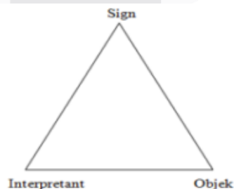
Gambar 2.1 Model Segitiga Peirce (Vera, 2014)

Berikut adalah model triadik atau konsep tritokomi Charles Sanders Peirce :