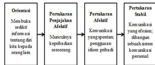
Gambar 2.1 Tahapan Proses Penetrasi Sosial