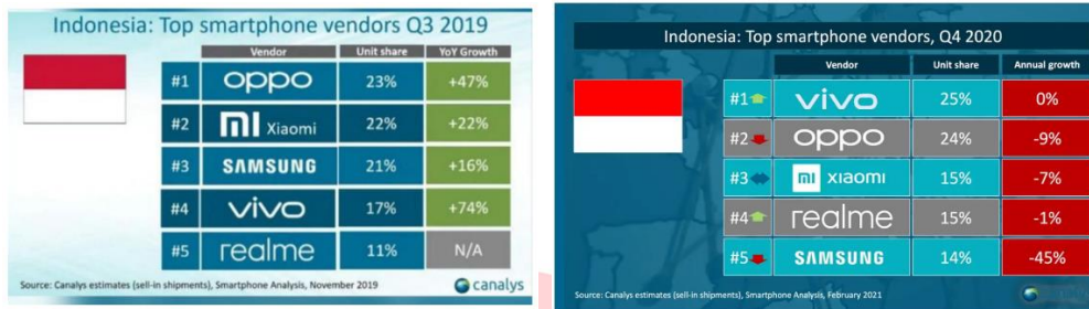
Gambar 2 Top Smartphone Vendors 2019 & 2020

Berdasarkan statistik dari Goodstats 2023, Indonesia, dengan jumlah penduduk 277 juta jiwa per 8 Agustus 2023 menurut Worldometers, menempatkannya sebagai negara dengan populasi keempat terbesar di dunia. Meskipun demikian, dalam hal penggunaan smartphone, Indonesia menempati peringkat keenam dengan jumlah pengguna mencapai 73 juta. Kondisi ini memberikan peluang besar bagi para produsen atau vendor smartphone untuk memasarkan produk di Indonesia. Data menunjukkan minat beli yang tinggi dalam penggunaan smartphone di negara ini, menggambarkan potensi pasar yang menjanjikan bagi perusahaan-perusahaan teknologi. Melalui strategi pemasaran yang tepat, peluncuran produk yang disesuaikan dengan preferensi lokal, serta fokus pada inovasi, perusahaan-perusahaan smartphone dapat memanfaatkan pasar yang besar ini. Data Gambar 2 & 3 menunjukkan Top Smartphone vendors 2019.