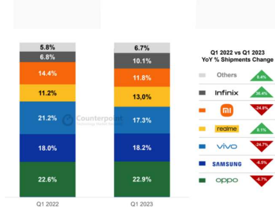
Gambar 3. Pangsa Pasar Ponsel Indonesia di Kuartal I-2023 (Sumber: Canalys estimates, 2020)

Dari gambar 2 di tahun 2019 Xiaomi menunjukkan pertumbuhan yang luar biasa dalam penjualan smartphone, meskipun berada di posisi kedua dengan pangsa pasar sebesar 22% berdasarkan unit penjualan. Perusahaan berhasil mencapai pertumbuhan sebesar 22% dalam pengirimannya, sejajar dengan pertumbuhan yang sama dari Oppo. Faktor-faktor yang menjelaskan posisi Xiaomi di belakang Samsung dan di depan Oppo termasuk momen strategis yang dimanfaatkannya ketika Oppo sedang berada di antara peluncuran produk. Ini memungkinkan Xiaomi untuk mengambil posisi kedua dalam pangsa pasar. Di tahun 2020 perusahaan ini saat ini berada di posisi kedua dengan pangsa unit sebesar 15% dan tingkat pertumbuhan Tahun-ke-Tahun (YoY) sebesar -7%. Faktor yang menyebabkan Xiaomi tidak menempati posisi pertama adalah ketatnya persaingan di industri smartphone.