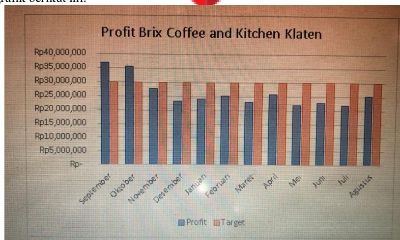
Grafik 2. Profit dan Target Brix Coffee and Kitchen Klaten (2023)

Brix Coffee and Kitchen Klaten juga cenderung mengalami penurunan profit, data penurunan profit ini dapat dijelaskan pada grafik berikut ini: