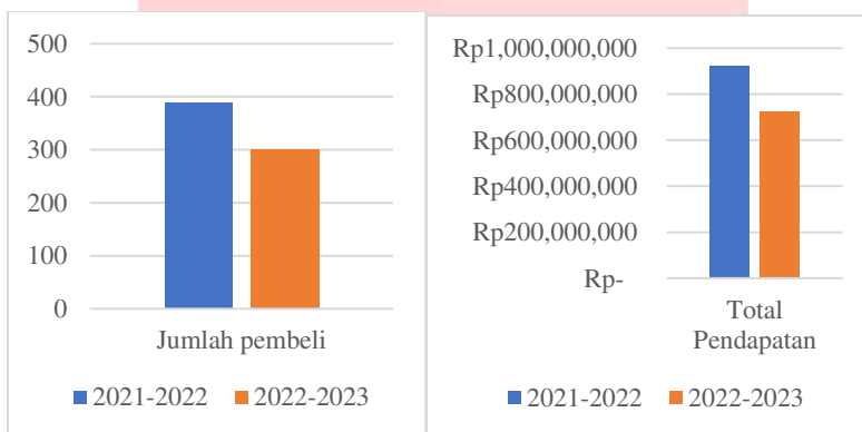
Gambar 1 Jumlah Pembeli dan Total Pendapatan 2 Tahun Terakhir

Pelaku UMKM harus belajar bagaimana memasarkan produk yang dimilikinya melalui media online agar lebih dikenal oleh masyarakat saat ini yang sudah tidak dapat dipisahkan dari teknologi. Hasil wawancara kepada pemilik Toko Besi Putra Baja mengenai hal tersebut, penulis mendapatkan informasi bahwa Toko Besi Putra Baja ikut serta dalam proses penjualan secara online , yang dikarenakan lokasi toko offline yang kurang strategis mengharuskan pemilik menggunakan marketplace untuk meningkatkan penjualan. Toko Besi Putra Baja melakukan penjualan online melalui marketplace Tokopedia dan Shopee, Penjualan online dimulai sejak tahun 2020 hingga saat ini. pendapatan e-commerce tokopedia dan shopee pada tahun 2021 - 2022 sebesar Rp921.881.550 dengan total sebanyak 388 pembeli. Sedangkan ditahun 2022 – 2023 terjadi penurunan pendapatan sebesar 21% yang dimana hanya mendapatkan Rp726.251.600 dengan total sebanyak 300 pembeli. Berikut grafik total data penjualan 2 tahun terakhir.