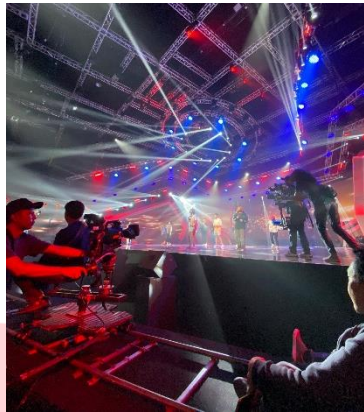
Gambar 3 : Pelaksanaan Grand Rehearsal