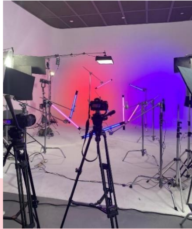
Gambar 1 : Studio Photoshoot

Tahapan brainstorming juga dilakukan pada saat pra produksi. Tahapan ini dilakukan untuk persiapan terhadap segala kebutuhan performa, seperti treatment yang dilakukan, properti yang dibutuhkan, lagu yang akan dibawakan, hingga wardrobe yang digunakan. Dengan adanya tahapan observasi terhadap referensi yang akan digunakan, hingga dokumentasi yang dilakukan, maka terciptanya sebuah ide visual yang dimiliki, serta apakah konsep dapat terealisasikan.