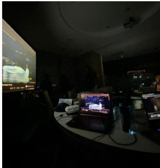
Gambar 2 : Tahapan Brainstorming

Tahapan brainstorming juga dilakukan pada saat pra produksi. Tahapan ini dilakukan untuk persiapan terhadap segala kebutuhan performa, seperti treatment yang dilakukan, properti yang dibutuhkan, lagu yang akan dibawakan, hingga wardrobe yang digunakan. Dengan adanya tahapan observasi terhadap referensi yang akan digunakan, hingga dokumentasi yang dilakukan, maka terciptanya sebuah ide visual yang dimiliki, serta apakah konsep dapat terealisasikan.