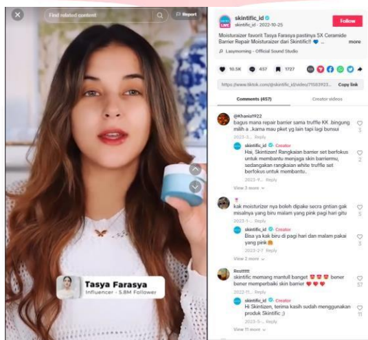
Gambar 2. Kolaborasi Skintific dengan Tasya Farasya

Influencer dan KOL memainkan peran penting dalam mengimplementasikan strategi pemasaran Skintific. Mereka tidak hanya membantu menjangkau audiens yang lebih luas, tetapi juga meningkatkan kredibilitas dan kepercayaan dalam pekerjaan mereka. Skintific berkolaborasi dengan berbagai influencer dan KOL yang membagikan konten yang relevan dengan target audiens mereka. Influencer dan KOL didorong untuk membuat konten menarik yang selaras dengan konten mereka, membuatnya lebih terorganisir dan berguna bagi audiens. Skintific juga sering berkolaborasi dengan influencer dalam peluncuran produk baru atau kampanye promosi untuk meningkatkan buzz danantisipasi di antara konsumen. Kolaborasi ini secara efektif meningkatkan kesadaran merek dan mendorong pembelian.