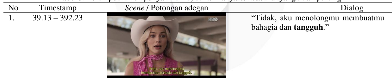
Tabel 3. Perempuan mempunyai makna, bukan hanya sekadar hal yang tidak penting

Prinsip keempat , perempuan berhak dalam mengungkapkan kebenaran tentang pengalaman yang mereka miliki. Adegan yang diambil adalah saat Barbie memberikan informasi kepada Sasha dan Gloria jika semua pekerjaan yang ada di Barbie Land dikerjakan oleh Para Perempuan. Perencanaan keuangan merupakan langkah penting untuk mencapai stabilitas dan masa depan yang terjamin. Dengan perencanaan yang matang, kita dapat mendisiplinkan diri dalam mengelola keuangan, sehingga terhindar dari pengeluaran impulsif dan mencapai tujuan keuangan jangka panjang. (Setyoningrum, 2020). Penelitian yang dilakukan oleh Widodo (2009) menunjukkan bahwa kemampuan perempuan dalam perencanaan keuangan terbukti dengan adanya keterlibatan istri dalam pengelolaan keuangan keluarga, didorong oleh stereotipe yang menganggap perempuan lebih ahli dalam mengatur keuangan dibandingkan laki-laki.