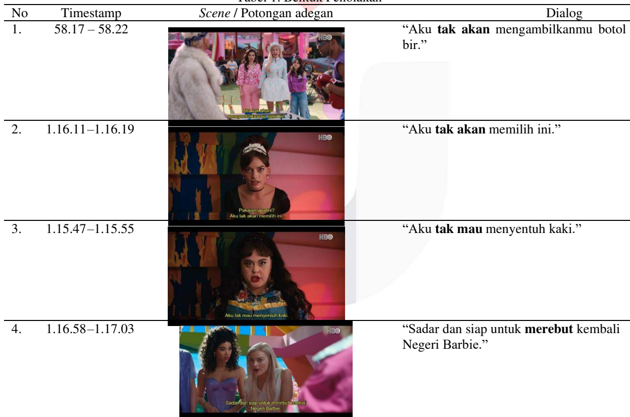
Tabel 1. Bentuk Penolakan

Prinsip kedua , menyebutkan perempuan berhak untuk menentukan nasibnya sendiri. Di mana pada prinsip ini terdapat pada adegan Para Barbie perempuan menunjukkan bisa menjadi apa saja dalam hal profesi. Penelitian yang dilakukan oleh Subhan (2004) mengatakan bahwa dalam masyarakat, perempuan sering kali distereotipkan secara