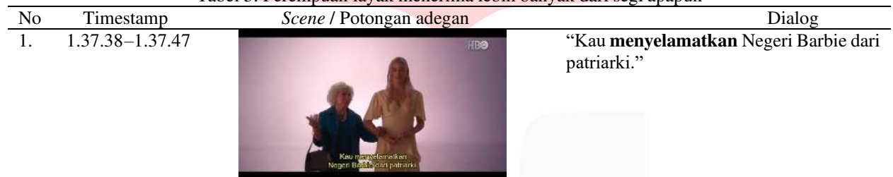
Tabel 5. Perempuan layak menerima lebih banyak dari segi apapun

Prinsip kelima , perempuan layak menerima lebih banyak dari segi apapun, seperti rasa hormat dari orang lain, rasa hormat terhadap dirinya sendiri, keselamatan, pendidikan, dan dalam hal keuangan. Pada prinsip ini terlihat pada adegan bahwa Barbie berhasil menyelamatkan Barbie Land dari patriarki. Hal ini menyangkut kesetaraan gender, di mana perempuan memiliki stereotipe sebagai kaum subordinatif dibandingkan laki-laki didukung dengan pernyataan Handayani (2006) menyebutkan bahwa karakteristik perempuan dikenal dengan lemah lembut, cantik, keibuan, dan sejenisnya, sedangkan laki-laki dianggap kuat, gagah, mempunyai pola pikir rasional, agresif, jantan, dan perkasa. Dengan demikian, bahwa pada adegan ini perempuan tidak ingin dipandang sebagai kaum yang lemah dan berhak untuk memiliki hak yang setara dengan laki-laki salah satunya dengan menjadi pemimpin.