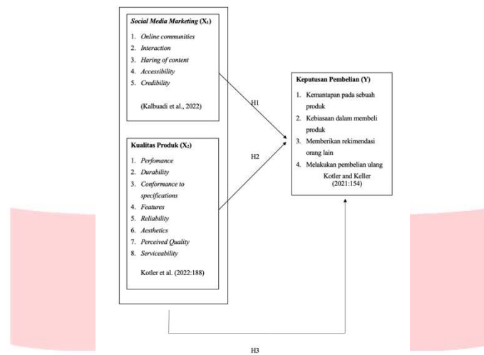
Gambar 2. 1 Kerangka Pemikiran

menyajikan variabel-variabel ini dalam sebuah kerangka pemikiran untuk memberikan pemahaman yang lebih jelas tentang bagaimana masing-masing variabel berinteraksi dan memengaruhi keputusan pembelian konsumen.