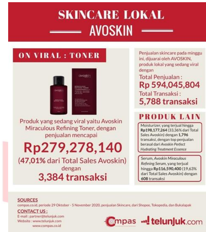
Gambar 1.3. Data Penjualan Produk Avoskin