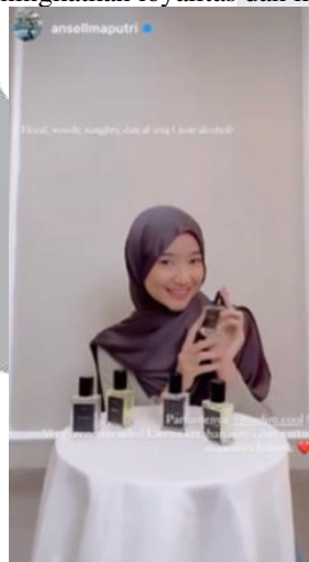
Gambar 4 Promosi Instagram

Prove membangun hubungan yang erat dengan pelanggan melalui komunikasi langsung di Instagram. Fitur live Instagram memungkinkan interaksi dua arah dengan pelanggan, memberikan pelayanan personal yang lebih baik. Prove mengadakan promosi melalui Instagram dan menyapa pengikutnya lewat fitur Instagram story. Kegiatan seperti bootcamp dalam event juga dilakukan untuk berinteraksi langsung dengan pelanggan dan memperkenalkan produk lebih dekat. Prove memiliki tujuan untuk meningkatkan loyalitas dan kepercayaan pelanggan.