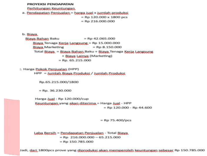
Gambar 5 Proyeksi Pendapatan

pekerja profesional. Prove juga memproyeksikan pendapatan yang meningkat seiring dengan pengembangan bisnis dan perluasan pasar.