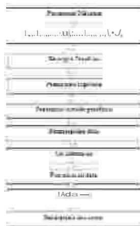
Gambar 2.3 Tahapan Penelitian