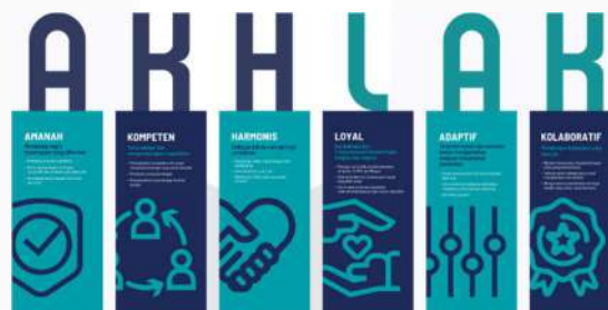
Gambar 2 Nilai Utama BUMN (Website BUMN, 2024)

PT Telkom Indonesia (Persero) Tbk. merupakan perusahaan Badan Usaha Milik Negara (BUMN) yang didirikan pada tahun 1965 yang bergerak di bidang teknologi dan informasi serta telekomunikasi digital di Indonesia. Telkom memiliki 12 anak perusahaan yang beroperasi di berbagai sektor yang memberikan kontribusi positif baik bagi para investor maupun masyarakat Indonesia. Telkom Indonesia berkomitmen kuat untuk membangun infrastruktur telekomunikasi dan informasi serta dunia digital Indonesia. PT Telkom Indonesia (Persero) Tbk. memiliki kantor pusat yang berlokasi di Kota Bandung dan kantor pusat operasional berada di Kota Jakarta Selatan, DKI Jakarta. Sebagai bagian dari BUMN, Telkom Group wajib menerapkan nilai-nilai utama yang dikenal sebagai AKHLAK (Amanah, Kompeten, Harmonis, Loyal, Adaptif, Kolaboratif). Berikut adalah gambar yang memperlihatkan nilai utama dari BUMN: