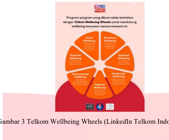
Gambar 3 Telkom Wellbeing Wheels (LinkedIn Telkom Indonesia 2024)

Unit Wellbeing memiliki peran penting dalam mendukung kesejahteraan karyawan, sebagai pihak yang merancang atau mengimplementasikan program kesejahteraan, mereka memahami isu-isu yang dihadapi oleh karyawan terkait dengan menjaga hubungan kerja dan pribadi. Selain itu, mereka memiliki informasi tentang kebijakan perusahaan yang mendukung keseimbangan kerja dan hidup yang relevan dalam memahami konteks komunikasi interpersonal. Sebagai bagian dari tugas mereka, pegawai pada unit ini memahami tentang yang dihadapi karyawan. Sehingga mereka dapat memberikan perspektif tentang bagaimana komunikasi interpersonal yang efektif dapat membantu mengatasi konflik atau tekanan dalam kehidupan kerja maupun pribadi. Pengalaman nyata dan perspektif yang dimiliki oleh pegawai membuat mereka menjadi informan yang relevan.