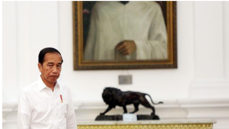
Gambar 2 Unggahan Berita “Cara Jokowi Menjaga Istana untuk Keluarga”