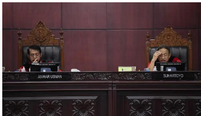
Gambar 1 Unggahan Berita " Putusan MK Soal Batas Usia Capres dan Cawapres Disebut Tragedi Demokrasi "

Gambar di bawah ini menampilkan unggahan berita dari Tempo yang berjudul " Putusan MK Soal Batas Usia Capres dan Cawapres Disebut Tragedi Demokrasi ". Berita ini menyoroti bagaimana proses hukum yang seharusnya netral justru dipertanyakan integritasnya karena dianggap memberikan karpet merah bagi kandidat tertentu dari lingkaran kekuasaan. Tempo menampilkan judul yang lugas dan kritis untuk menggugah kesadaran publik terhadap ancaman sistemik terhadap prinsip-prinsip dasar demokrasi.