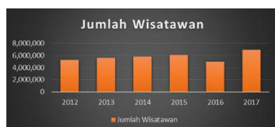
Gambar 1 Jumlah Wisatawan di Kota Bandung

Menurut Humas Kota Bandung (2018), Bandung kembali terpilih menjadi kota pariwisata terbaik pada acara IAA ( Indonesian Attractiveness Award ) yang dilihat dari sektor investasi, infrastruktur, layanan publik dan pariwisata. Adapun jumlah wisatawan berdasarkan data Dinas Kebudayaan dan Pariwisata Kota Bandung serta artikel Pikiran Rakyat dari (Abdul, 2018) adalah sebagai berikut.