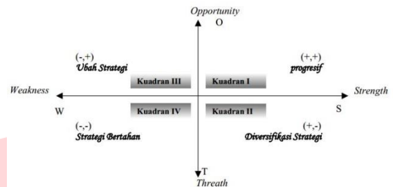
Gambar 3 Kuadran SWOT

Hasil IFAS dan EFAS digunakan sebagai dasar perhitungan dalam menetapkan sumbu dan posisi kuadran perusahaan. Adapun penentuan posisi kuadran Menurut (Rangkuti, 2014 )