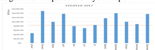
Gambar 1 Grafik Pendapatan Tahun 2017

Menurut hasil wawancara dengan Bapak Cahyoga selaku CEO Eduplex Coworking Space beberapa implementasi strategi pemasaran telah dilakukan, namun melihat data keuangan menunjukkan pendapatan perusahaan mengalami kondisi yang fluktuatif (tidak stabil) dan pencapaian target belum dapat seluruhnya tercapai.