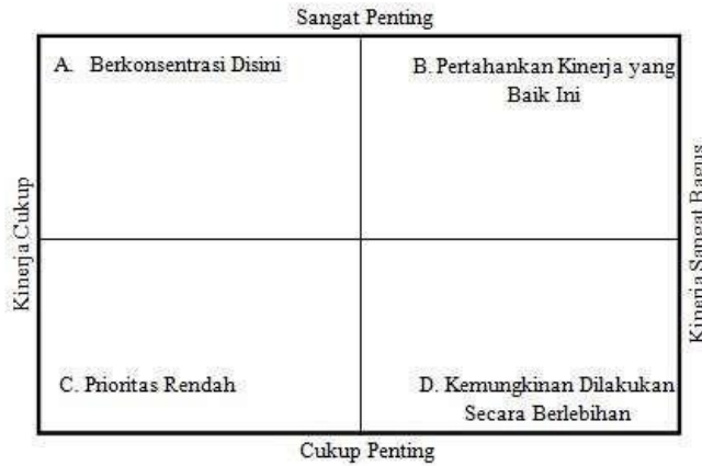
GAMBAR 2 IMPORTANCE PERFORMANCE FRAMEWORK Sumber: Kotler & Keller (2009:58)

Importance Performance Analysis (IPA) adalah prosedur untuk menunjukkan kepentingan relatif berbagai atribut terhadap kinerja organisasi atau perusahaan, produk. Importance performance Analysis (IPA) awalnya digunakan sebagai alat untuk menyusun strategi manajemen perusahaan. Pada hakikatnya, IPA mengkombinasikan pengukuran dimensi ekspektasi dan kepentingan ke dalam dua grid, kemudian kedua dimensi tersebut diplotkan kedalamnya. Nilai kepentingan sebagai sumbu vertikal sedangkan nilai ekspektasi sebagai sumbu diagonal dengan menggunakan nilai rata-rata yang terdapat pada dimensi kepentingan dan ekspektasi sebagai pusat pemotongan garis (Wijaya, 2011:75).