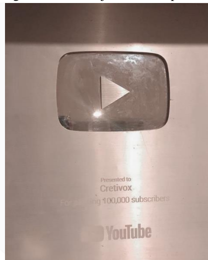
Gambar 1. Penghargaan Cretivotx

Sebagai perusahaan yang secara langsung bersinggungan dengan klien, tentunya Cretivotx telah mengimplementasikan tiga pendekatan strategi marketing public relations . Berdasarkan pandangan Ruslan (2010), pendekatan yang dimaksudkan adalah strategi push , pull dan pass . Cretivotx mempunyai sebuah konsep strategi marketing public relations yang lebih terencana, terarah dan juga terkoordinasi. Hal ini dilakukan untuk dapat memberikan suatu kepuasan kepada pelanggan ataupun klien. Kesuksesan dari sebuah strategi pemasaran dapat memberikan kesuksesan juga kepada kinerja perusahaan. Pasalnya, selama 3 tahun didirikan, Cretivotx sudah dapat berkembang secara digital dengan total pengikut media sosial Instagram yang dimiliki sebanyak 319.000. Jumlah tersebut dapat dilihat pada akun @cretivotx. Selain itu, Cretivotx juga memiliki total 744.000 subscriber pada akun Youtubenya yaitu “Cretivotx” dan sebanyak 396.800 followers pada akun TikToksnya @cretivotx. Hal tersebutlah yang membuat peneliti memilih Cretivotx sebagai salah satu objek di dalam penelitian ini.